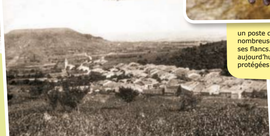
Environs de Toul illustré Vue générale de PAGNEY

Nous avons eu la chance de rencontrer, dès 1990, les pionniers du CSL et nous sommes fiers de ce travail accompli. Encore merci et bravo au CSL pour ce bel exemple de partenariat efficace.